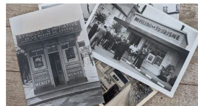
UN SIÈCLE DE TOURISME À COGNAC

2 semaines : 85 € HT / 102 € TTC 2x2 semaines consécutives : 150 € HT / 180 € TTC 3x2 semaines consécutives : 200 € HT / 240 € TTC