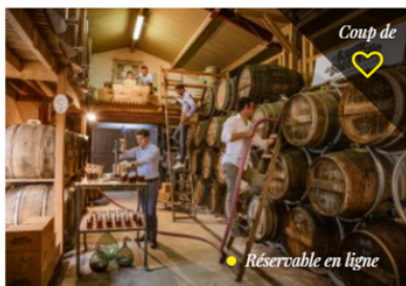
La Compagnie de Bouteville Bouteville - Jusqu'au 30 septembre